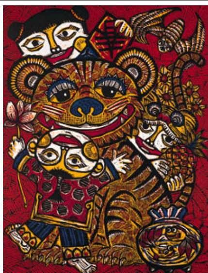
潘勁瑞 絹版 虎年吉慶